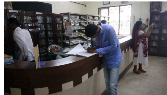
Visitors giving Feedback