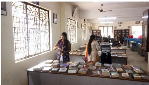
Student seeing books